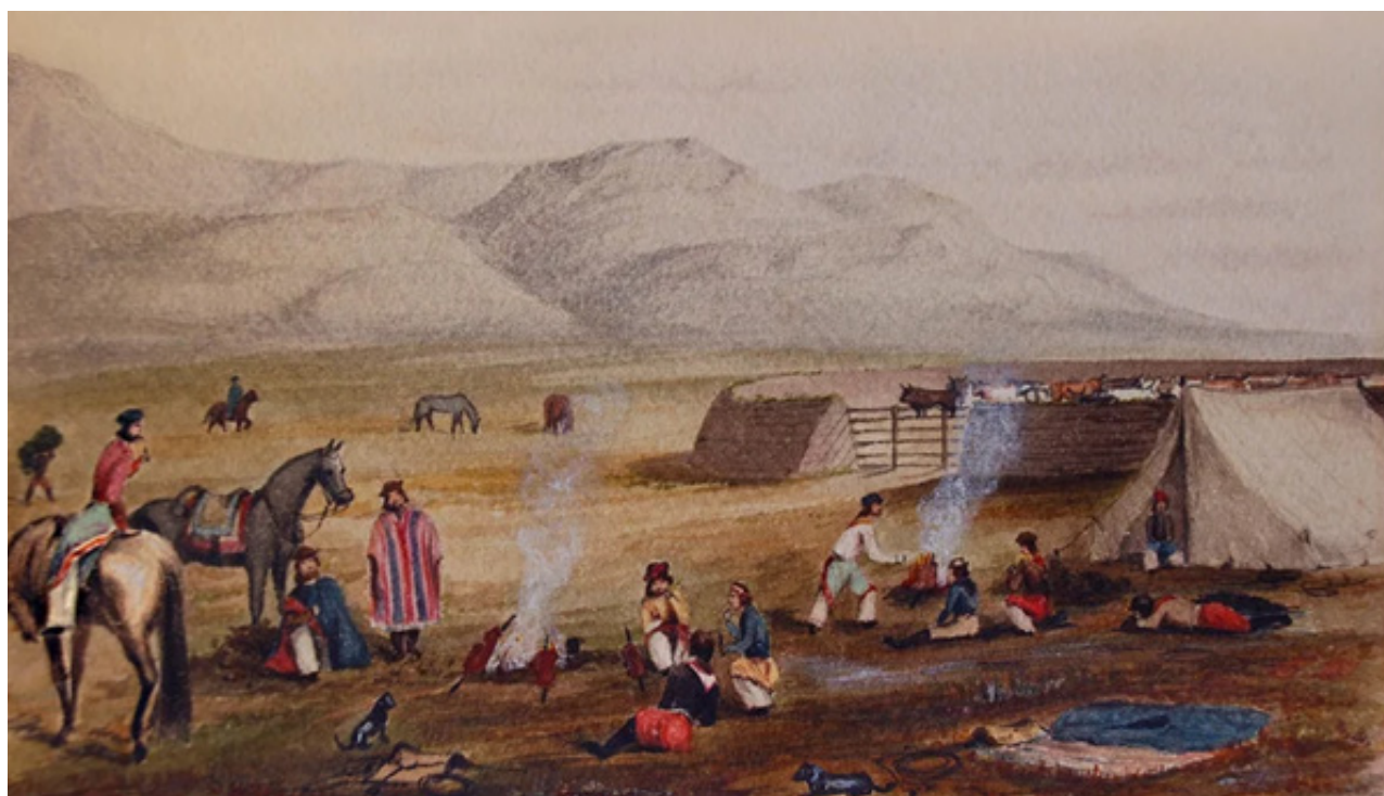
Figura 4. "Gauchos en Malvinas". Acuarela de William Dale (1852), en Baccaceci (2018).