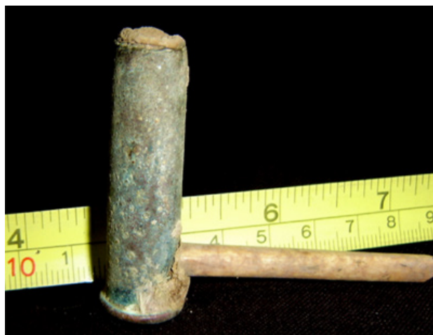
Figura 3. Pipa-bala. Fotografía en Landa (2011).

como gesto y materia profundamente dependiente de la memoria distribuida en objetos y personas (Leroi Gourhan, 1971), parecía dar pautas claras para formar una tipología (Lucas, 2012, p. 19). Tomando en cuenta que la mayoría de los recipientes utilizados eran vasos de fragmentación de una granada española EA-M5, el equipo decidió crear una nueva tipología: el mate-granada (Figura 2).