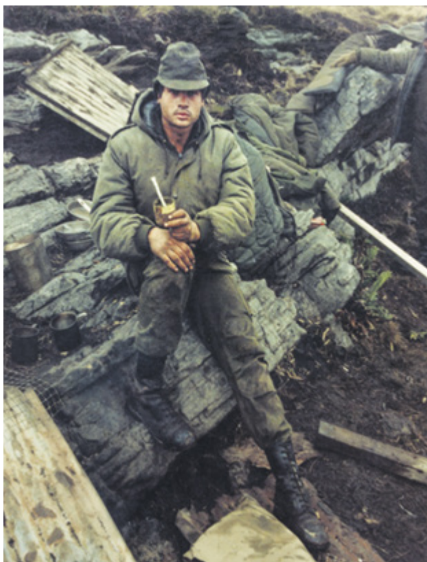
Figura 2. Mate-granada.

En particular los objetos que se repetían en el ochenta por ciento de las entrevistas eran distintos tipos de mates creados con diversos materiales como contenedores pero con una técnica similar 1 . La misma consistía, en primer lugar, en agujerear con un metal caliente el extremo plástico de una birome Bic que sirviera como bombilla. Luego, se creaba un recipiente en base a algún objeto reutilizado -granada o lata de comida-. Por último, el recipiente se rellenaba usando distintas materias primas como yerba, leche en polvo, azúcar y hasta turba 2 . La técnica, pensada