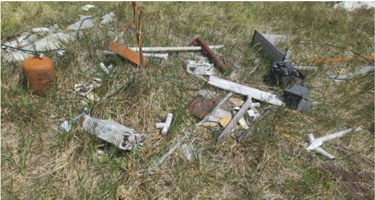
Figura 1. Conjunto depositacional en Monte Enriqueta, Islas Malvinas.